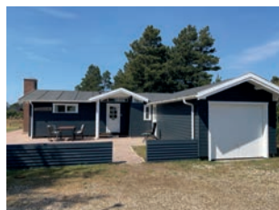
HENNE STRAND – »HØNEN«