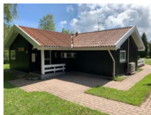
DRONNINGMØLLE – »HANEN«