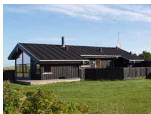
TVERSTED – »KLITTEN«