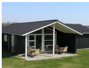
»LALANDIA – B88«