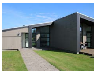
»LALANDIA – B20«